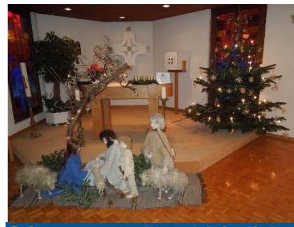
Stimmungsvoll und feierlich

Im Kreise ihrer Liebsten feierten die Bewohner der Häuser Bahnmatt und Martinspark ein stimmungsvolles Weihnachtsfest.