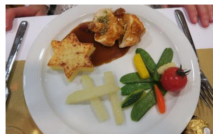
Das Gala-Menü setzte einen Höhepunkt

Auch dieses Jahr setzte der kulinarische Teil einen weiteren Höhepunkt. Die in warmen Goldtönen wunderschön dekorierten Festtagstische sorgten für das weihnachtliche Ambiente. Mit viel Kreativität und Können zauberte die Küchencrew ein 4-Gang Gala-Menü auf den Tisch. Selbstverständlich fehlten auch die legendären, hausgemachten Weihnachtsguetzli nicht.