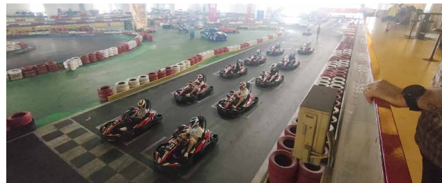
Ein spannendes Rennen startet

Für die Action-Liebhaber stand Kartfahren auf dem Programm. Sie lieferten sich einen spannenden Wettkampf, bei dem jeder sein Bestes gab, um den Sieg zu erringen. Die Strecke war herausfordernd und bot viele Möglichkeiten zum Überholen. Nach dem Adrenalin-Hoch und der Siegerehrung folgte ein gemütliches, gemeinsames Essen.