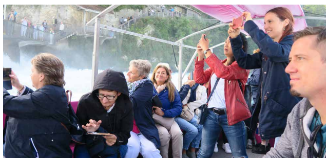
Ganz nah ging es an den Rheinfall heran

Drei tolle Personalausflüge boten im 2023 Abwechslung vom Alltag. An zwei Terminen waren grosse Gruppen bei traumhaftem Wetter am Rheinfall und in Schaffhausen. Schöne Zugreisen, eindruckliche Bootsfahrten bis ganz nah an den grössten Wasserfall Europas, feines Mittagessen und die schöne Altstadt von Schaffhausen sorgten für rundum zufriedene Reisegruppen.